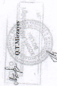
O'ZDSMI "Vokal" kafedrasini professori

Yuqoridagilardan xulosa qilib 60112400-Professional ta'lim (60211900-Xalq ijodiyoti (vokal ijrochiligi) ta'lim yo'nalishi) sohasida OTMga kirish uchun tuzilgan mazkur dasturni amaliyotga tavsifiya etaman.