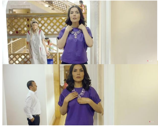
“Ma'suma” filmidan kadrlar

Operator epizod boshidagi, voqea makonini ko'rsatish uchun qo'yiladigan umumiy planni odatdagidek chetdan kuzatuvchi sifatida yaratmaydi. Kadrlarning umumiy voqeada to'rtinchi yoki beshinchi planda turgan qahramon nigohi sifatida qo'yilishi tomoshabinni voqeaga e'tiborini kuchaytiradi. Qahramonlar xatti-harakati har xil rakurslarda ko'rsatilgani holda aniq bir yo'nalishda asosiy fikrni ochishga qaratilgan. Masalan, beshinchi daqiqa ellik birinchi soniyada subektiv umumiy plan orqali Nasibaning o'g'li hovli tomida kabutar uchirib yurgani ko'rsatiladi. Panorama bilan pastga tushgan umumiy plan