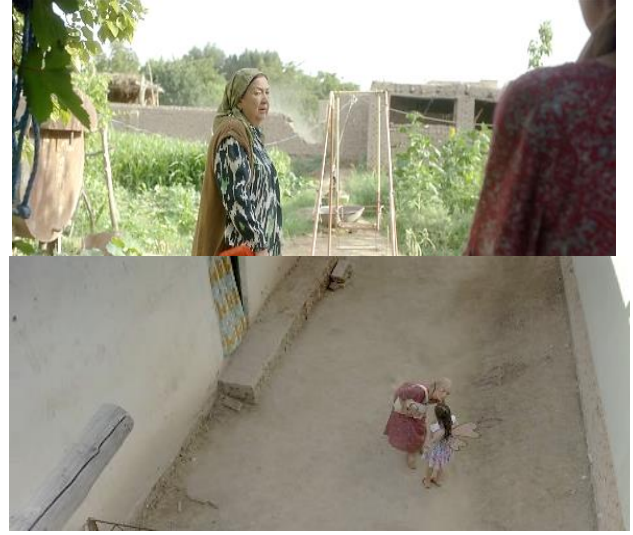
“Ma’suma” filmidan kadrlar

Film tasviriy obrazlari yaratilishida operatorning yorug‘likdan mahorat bilan foydalana olishi ahamiyatli. Ushbu filmdagi tunda bo‘lib o‘tadigan epizodlar, interer va ekstererda kadrlarning o‘ziga xos yoritilishi, tasvirning uzluksiz harakatda yaratilishi sahnalashtiruvchi operator mahoratidan dalolat beradi. Jumladan, qirq yettinchi daqiqa yigirma yettinchi soniya o‘rta planda Nasibaning ovsini telefonda sms o‘qishi bilan boshlanadigan epizodni kuzatish mumkin. Orqa fonda uyga qo‘yilgan yorug‘lik sovuq oy nurini hosil qilgan. Uy ichidagi chiroqlar issiq rangda eshik va derazalardan ko‘rinib turibdi. Malikaning ovsiniga kameraning yuqori chap tomonidan qo‘yilgan ikki kanal baland issiq rangdagi yorug‘lik chizuvchi sifatida xizmat qiladi. Keyingi o‘rta planda Nasibaning qizi o‘tiribdi. Uning ham orqa fonidagi katta hovli oy shu‘lasining sovuq rang effekti bilan yoritilgan. Yuqori o‘ng tomondan qo‘yilgan issiq yorug‘lik qizchaga ham chizuvchi sifatida ishlaydi.