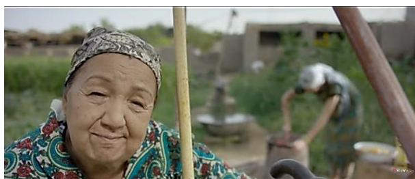
"Ma'suma" filmidan kadr