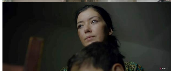
“Ma’suma” filmidan kadrlar